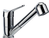
Mitigeur S1000 - Z65 8449 500